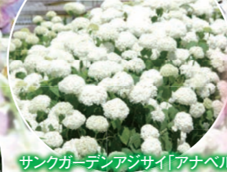
サンクガーデンアジサイ「アナベル」