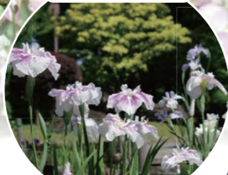
日本庭園 ハナショウブ