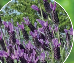
パークブリッジ ラベンダー「アボンビュー」