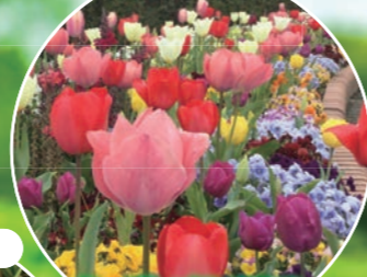
ガーデンプラザ周辺 チューリップ