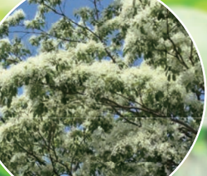
わんぱく冒険広場 ヒトツバタゴ