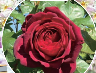
ガーデンプラザ前 バラ