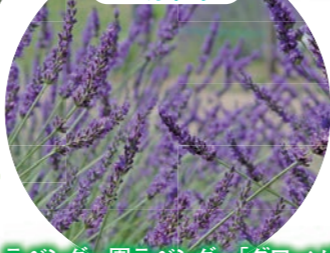
ラベンダー園ラベンダー「グロッソ」