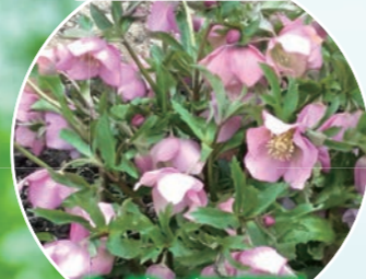
ガーデンプラザ周辺 クリスマスローズ